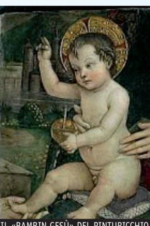
IL «BAMBINO GESÙ» DEL PINTURICCHIO