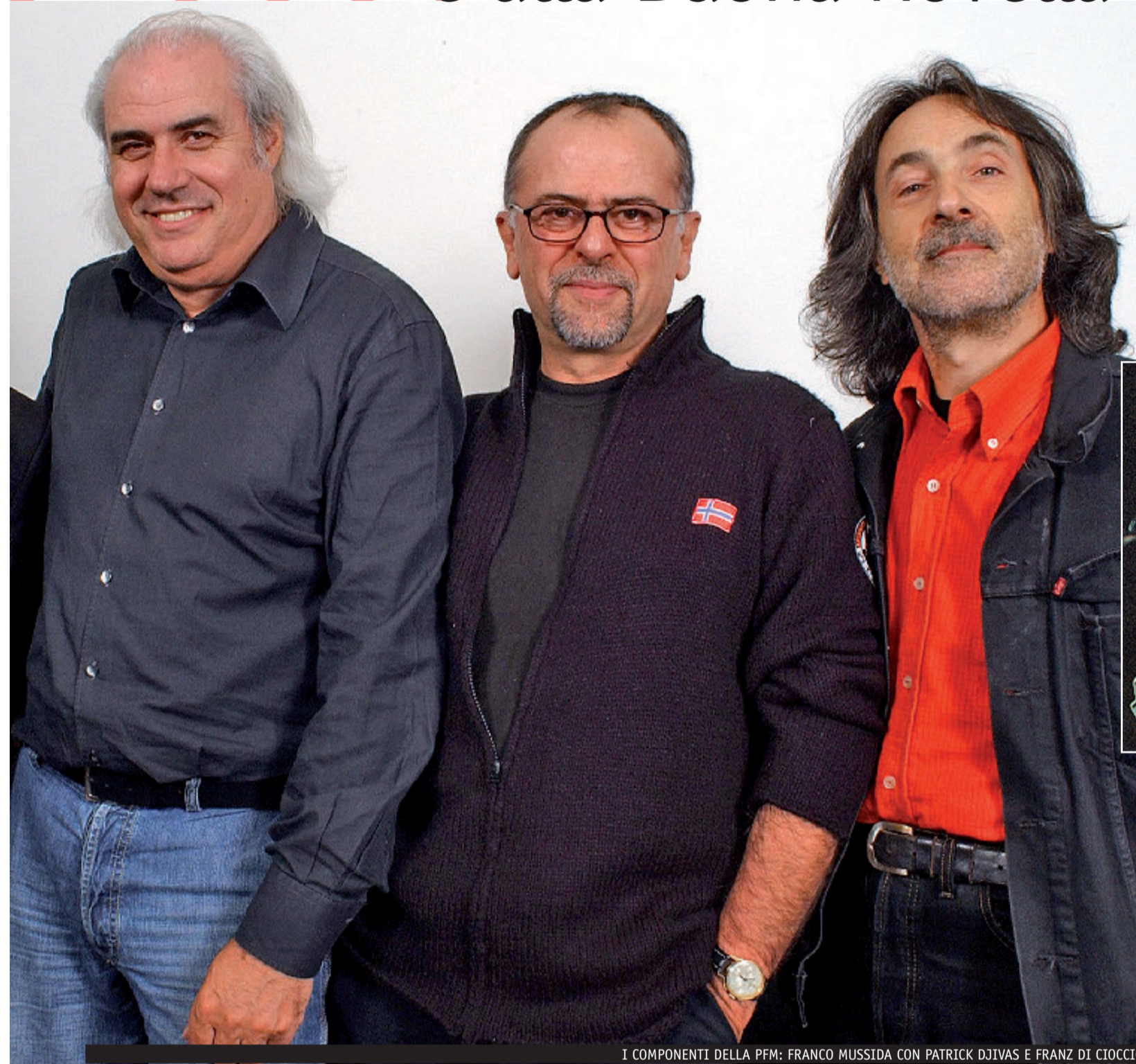
I COMPONENTI DELLA PFM: FRANCO MUSSIDA CON PATRICK DJIVAS E FRANZ DI CIOCCIO

E lei cosa imparò dell'uomo De André? «Cercava sempre. Aveva grande capacità di leggere le cose in una dimensione spirituale, coinvolgente, anticipatrice. Come tutti immersi nella fatica del vivere, nell'arte faceva